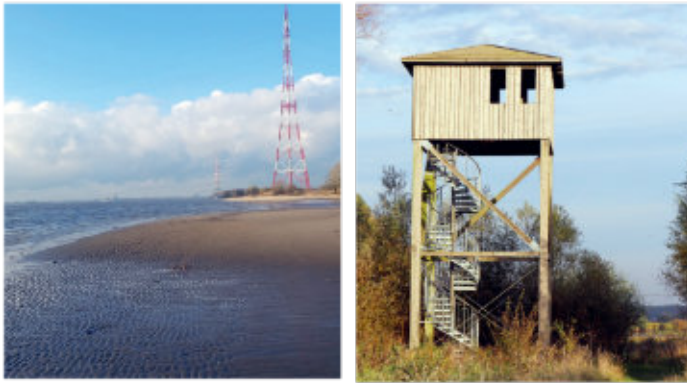
Dem Deichverteidigungsweg binnendeichs folgen bis zum Schanzenturm am Hetlinger Schanzenteich.

Zwei Deichübergänge ermöglichen uns weitere abwechslungsreiche Ausblicke auf die Tidelebensräume im Deichvorland. Vom Deichübergang gegenüber der Straße Richtung Hetlingen (Höhe Kläranlage) sehen wir ausgedehntes Tideröhricht mit Tideauwald-Inseln. Dem Watt im Vorland folgt auf höher gelegenen Flächen Röhricht mit Weidengebüsch als Übergang zum weiter erhöht wachsenden Tideweiden-Auwald. Rohrsänger, Bart- und Beutelmeisen bauen hier ihre Nester, so dass die Flut ihnen nichts anhaben kann. Beim Deichübergang an der Hetlinger Schanze überrascht das Vorland mit dem Hafen und dem Zugang zum Elbstrand.