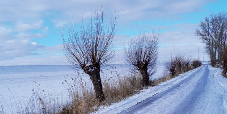
Winterstimmung Wedeler Marsch