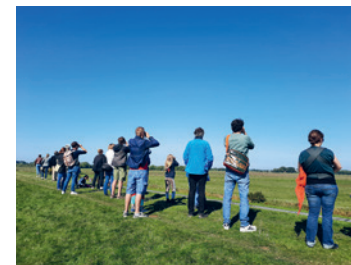
Vogelbeobachtung am Deich

Anmeldung: www.NABU-Hamburg.de/anmeldung .