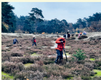
Entkusseln in den Holmer Sandbergen

Samstag, 09.11.2024, 14–16:30 Uhr Regionalpark-Aktionstag in den Holmer Sandbergen