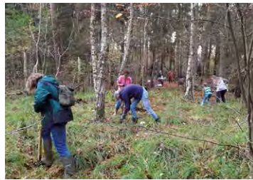
Naturschutz-Aktionstag im Bredenmoor

Nachdem der Aktionstag witterungsbedingt im Herbst 2023 ausfallen musste, lädt der Regionalpark zusammen mit der Stadt Pinneberg jetzt ein, gemeinsam unerwünschte Pflanzen aus dem Moor zu ziehen, um die Fläche des Bredenmoors naturschutzfachlich wertvoller zu machen. Auch werden bereits abgesägte Baumstämme aus dem Moor herausgetragen. Jede Hand ist willkommen. Für Getränke und kleine Snacks ist gesorgt. Treffpunkt: Bredenmoor Pinneberg, nähere Infos bei Anmeldung Anmeldung: info@regionalpark-wedeler-au.de