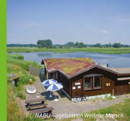
NABU-Vogelstation Wedeler Marsch