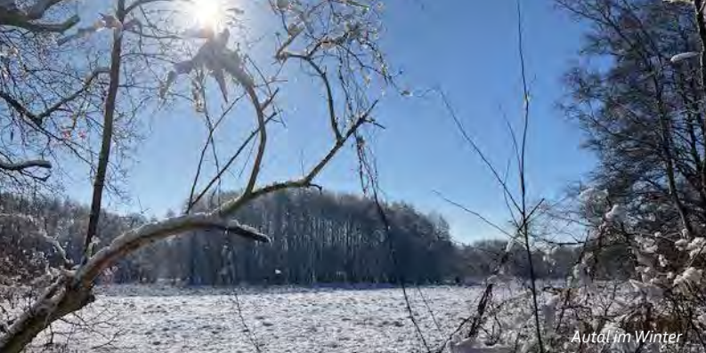
Autal im Winter