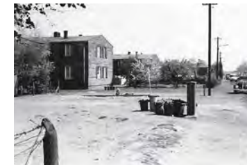
Feldstraße Wedel, 1950er

Anmeldung: (bis zum 04.01.24) Almut Goroncy 04103-5217 oder tumlago@kabelmail.de Info: www.zeitzeugenboerse-wedel.de