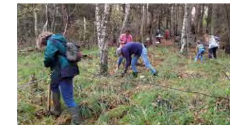
Naturschutz-Aktionstag im Bredenmoor

Vielerorts werden Bäume gepflanzt, aber der Regionalpark bläst zu Aktionstagen, an denen klimawichtige Bäume rausgerupft werden sollen? Warum? Es gibt tatsächlich Orte, an denen Bäume eher klimaschädlich sind. So etwa in Mooren. Denn Moore bieten nicht nur eine tolle Krimikulisse, sie sind auch unverzichtbar in Sachen Klimaschutz.