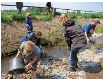
Bach-Aktionstag Hamburg-Rissen, August 2018

Gemeinsam schaffen wir natürliche Lebensräume für viele Bachbewohner. Jede helfende Hand ist willkommen! Bitte wetterfeste Kleidung mitbringen. Kinder dürfen nur in Begleitung eines Erziehungsberechtigten teilnehmen.