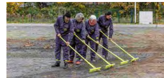
feine menschen

Die Kunstgruppe feine menschen , deren besondere Arbeit sich auf die Historie des Pinneberger Fahlt konzentriert, lädt diesmal ins Pinneberger Museum ein! Lassen wir die Sommerfrische Pinneberg wieder aufleben! Pinneberger Museum, Dingstätte 25