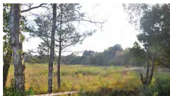
Schnaakenmoor im Herbst