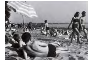
Wedeler Strandbad in den 1950ern

Wie wird aus einem alten T-Shirt ein praktischer Einkaufsbeutel? Zu dieser Veranstaltung bitte alte T-Shirts/Unterhemden mitbringen! Ort: Pinneberger Baumschulmuseum, Halstenbeker Str. 29 Kosten: 5 €