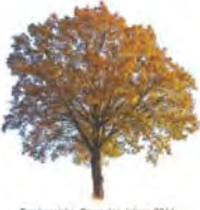
Traubeneiche, Baum des Jahres 2014