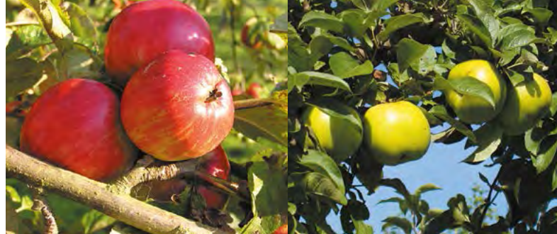
Schöner aus Haseldorf